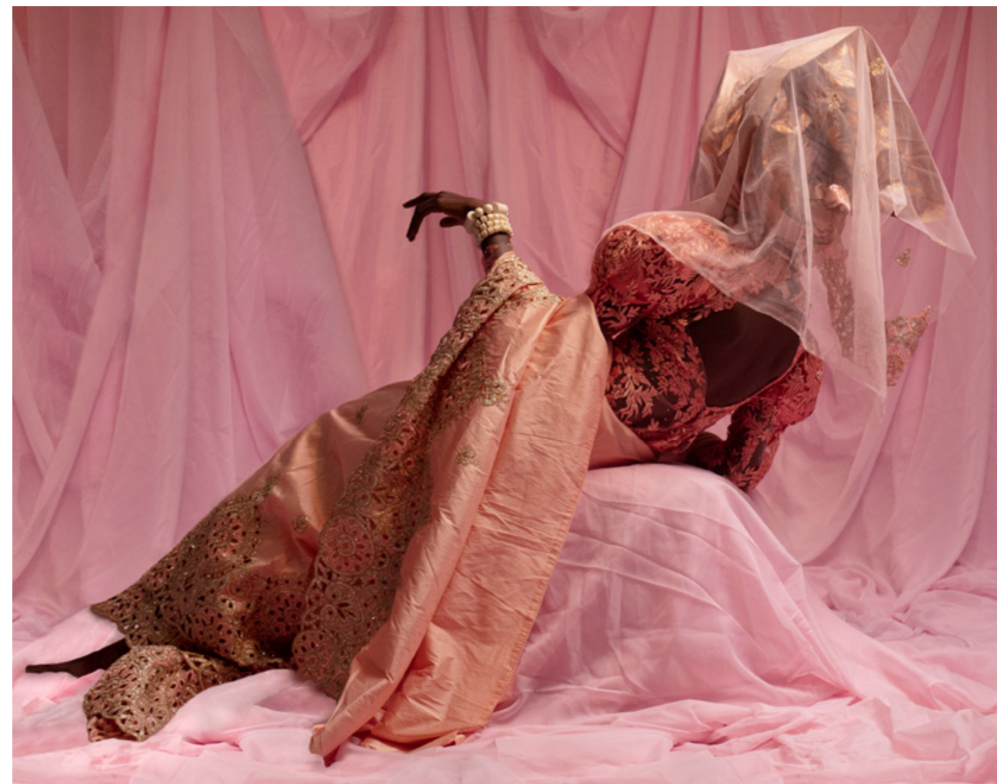
THAMI MNYELE FOUNDATION, LAKIN OGUNBANWO. (DIGITALE TENTOONSTELLING JCDECAUX)