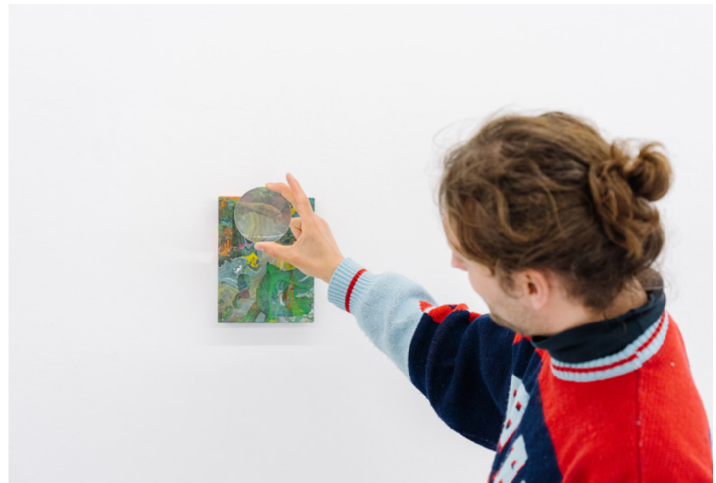
VISITORS OF AMSTERDAM ART WEEK, 2022.

Amsterdam Art onderschrijft de vijf waarden uit de Fair Practice Code en gebruikt deze als leidraad voor haar handelen. Solidariteit, Duurzaamheid, Diversiteit en Vertrouwen vloeien logischerwijs voort uit de missie om het hedendaagse beeldende kunstklimaat te versterken en om hier in samenwerking met de 65 deelnemers invulling aan te geven. Bij goed opdrachtgeverschap en fair practice binnen de eigen