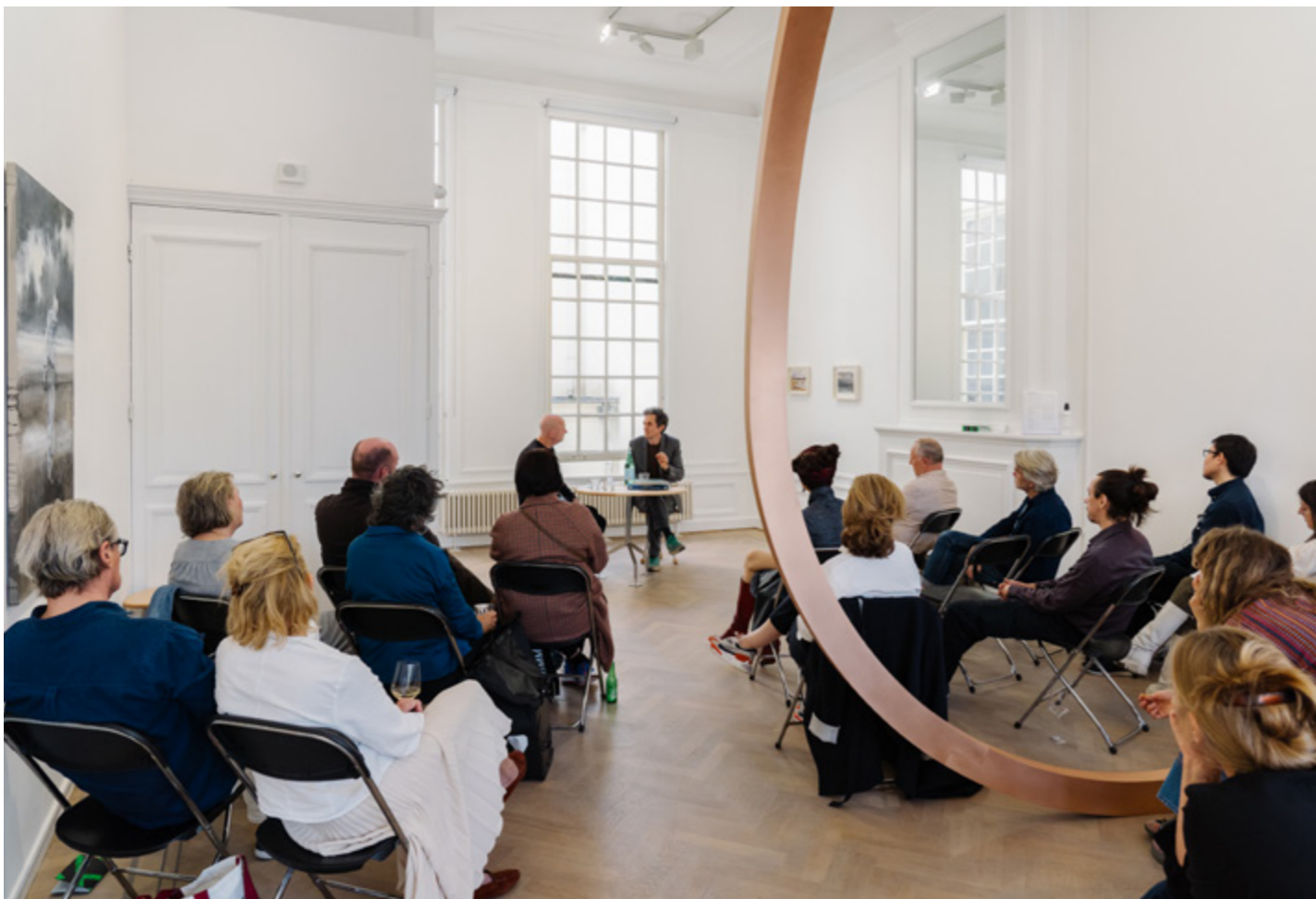
ARTIST TALK AT GRIMM, AMSTERDAM ART WEEK, 2022.