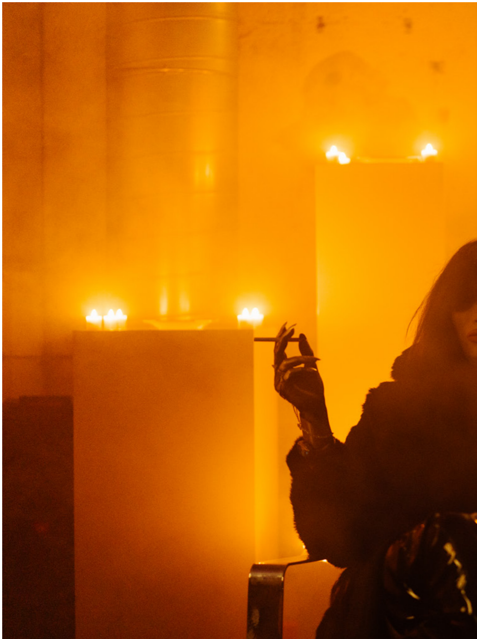
PERFORMANCES IN HET HEM, 2022.