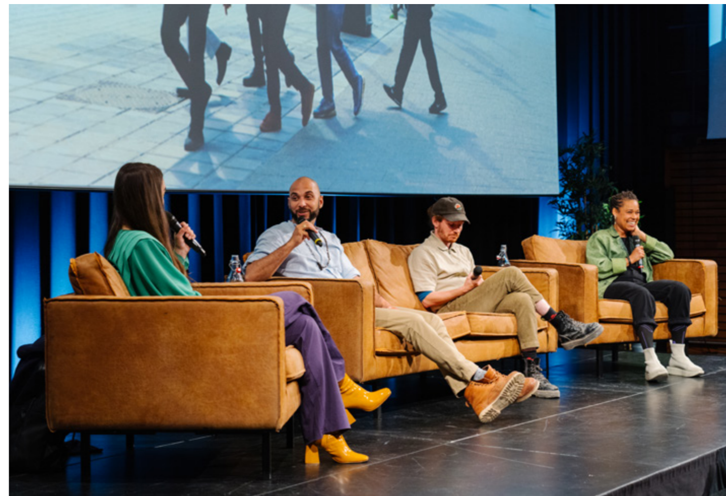
DAY 1, AMSTERDAM ART WEEK, 2022.

ABN Amro Collectie, Power of Art , groepstentoonstelling, en We just want to be closer , Neo Matloga; Akzo Nobel Art Foundation, All Eyes , groepstentoonstelling.