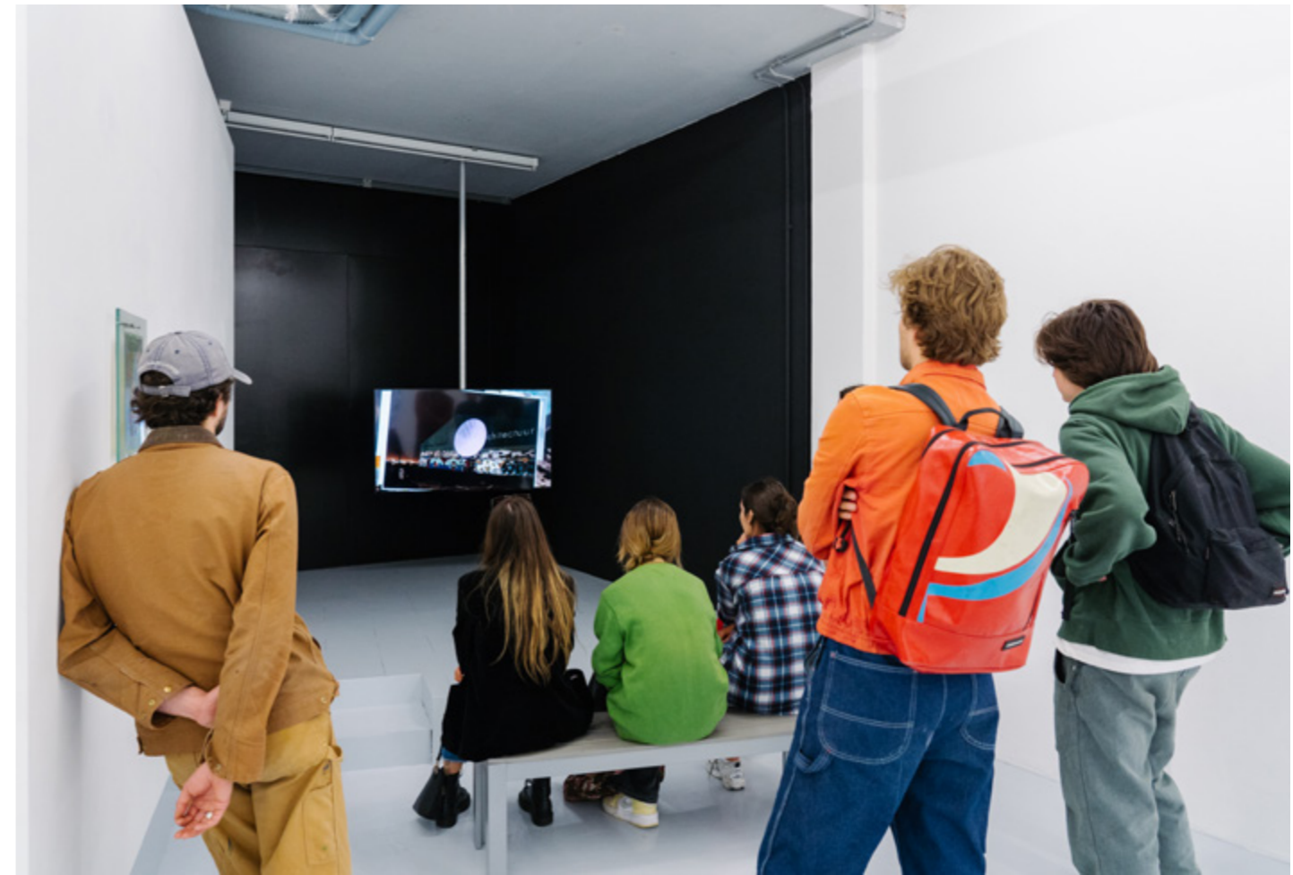
VISITORS OF AMSTERDAM ART WEEK, 2022.