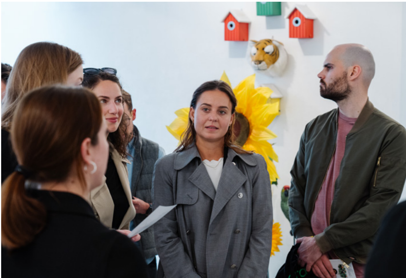
YOUNG PROFESSIONALS NIGHT, AMSTERDAM ART WEEK, 2022. FOTOGRAAF ALMICHEAL FRAAY