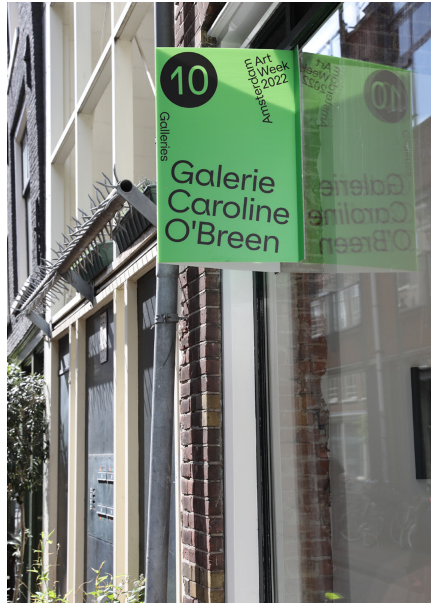
MAKELAARSBORDEN BIJ GALLERIES, 2022

De Uitkrant verschijnt tien keer per jaar en heeft een bereik van 180.000 per editie. De oplage is 60.000 per editie. Amsterdam Art organiseert maandelijks een selectie van tentoonstellingen van vier deelnemers. Dit is een grote zichtbaarheid voor een doelgroep die op zoek is naar het actuele aanbod in Amsterdam.