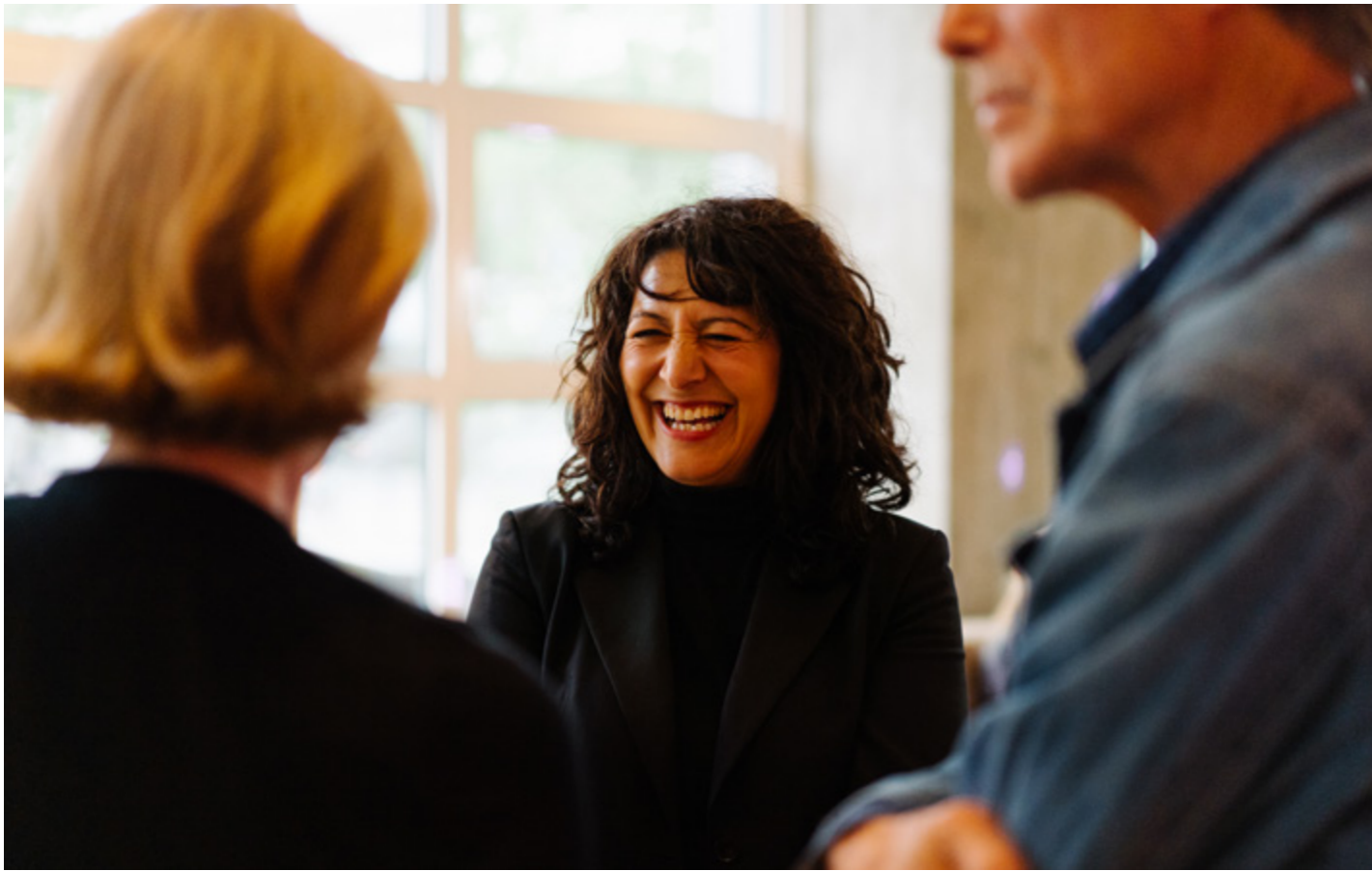
DAY 2, OPENING CAPITAL C, AMSTERDAM ART WEEK.