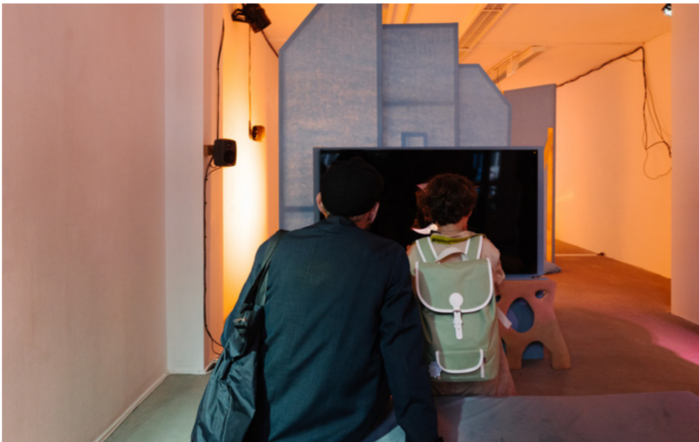
DAY 3, AMSTERDAM ART WEEK. FOTO: ALMICHEAL FRAAY