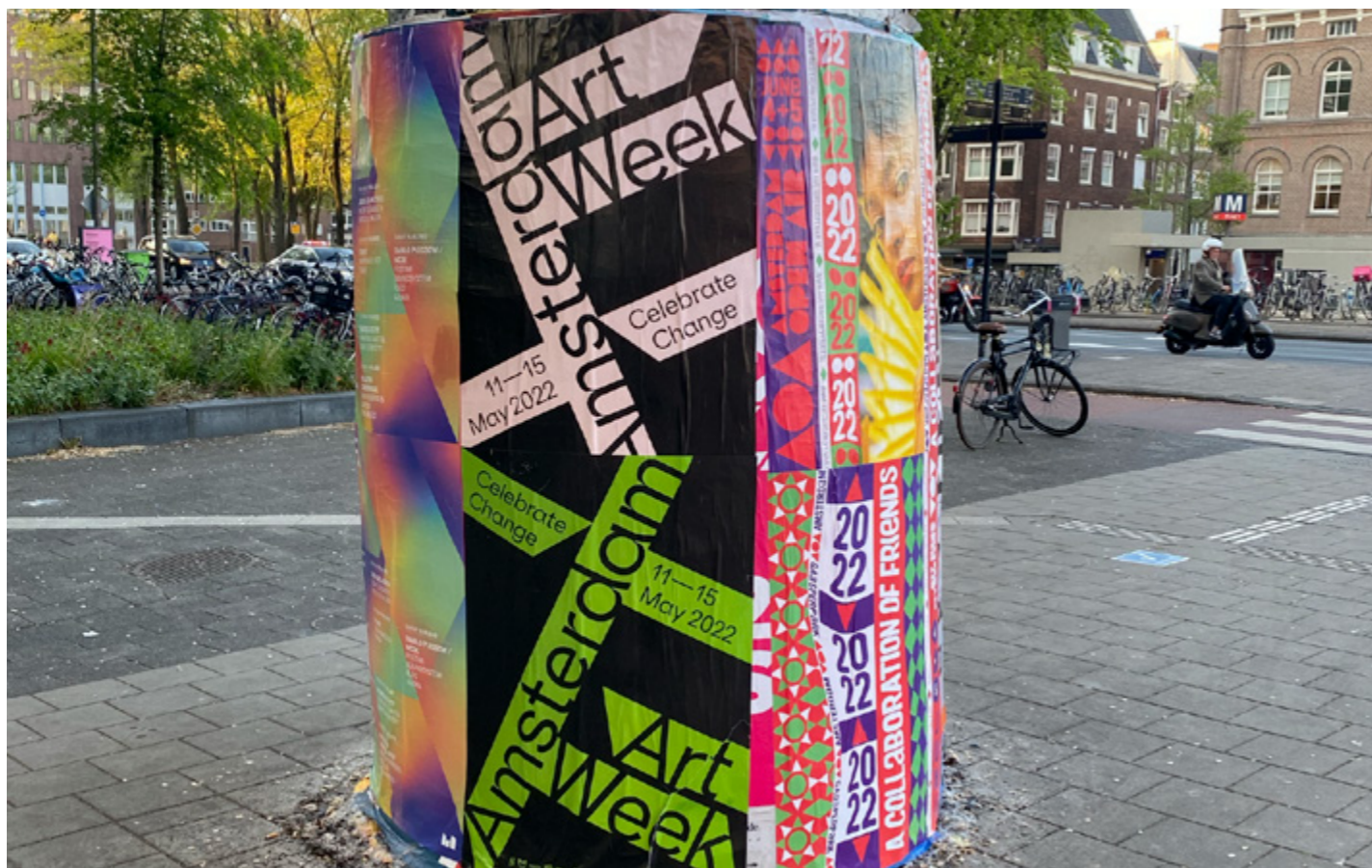
MAKELAARSBORDEN VOOR DE DEELNEMENDE INSTELLINGEN

De huisstijlkleuren van Amsterdam Art bestaan uit zeven signaalkleuren die verwijzen naar de zeven categorieën waarin de deelnemers zijn ingedeeld: galeries, jonge sectie, projectruimtes, residencies, musea en bedrijfscollecties. Deze kleuren worden gebruikt voor de promotie van het aanbod van de 66 deelnemers gedurende het hele jaar via de website, digitale nieuwsbrief en de Amsterdam Art Guide. Voor de campagne van Amsterdam Art Week veranderen de kleuren jaarlijks. Twee opvallende kleuren worden hiervoor gebruikt, aangevuld met zwart, wit of zilver. Dit markeert de tijdelijkheid van het evenement en creëert een gevoel van urgentie, waardoor de campagne onderscheidend en herkenbaar is. Binnen de identiteit worden lettertypen uit dezelfde familie gebruikt die goed bij elkaar passen: Klarheit Grotesk en Klarheit Kurrent. Beide werden in 2020 gelanceerd door de jonge typefoundry Extrasets. Het is een krachtig en modern lettertype dat goed past bij de identiteit van Amsterdam Art.