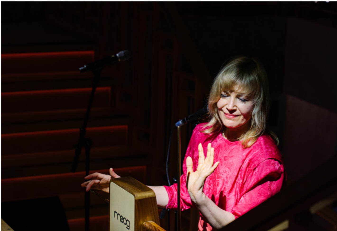
DAY 2 AMSTERDAM ART WEEK, 2022.