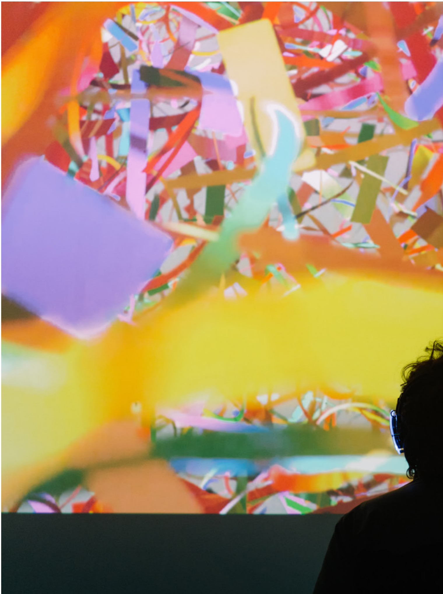
DAY 4, AMSTERDAM ART WEEK, 2022.