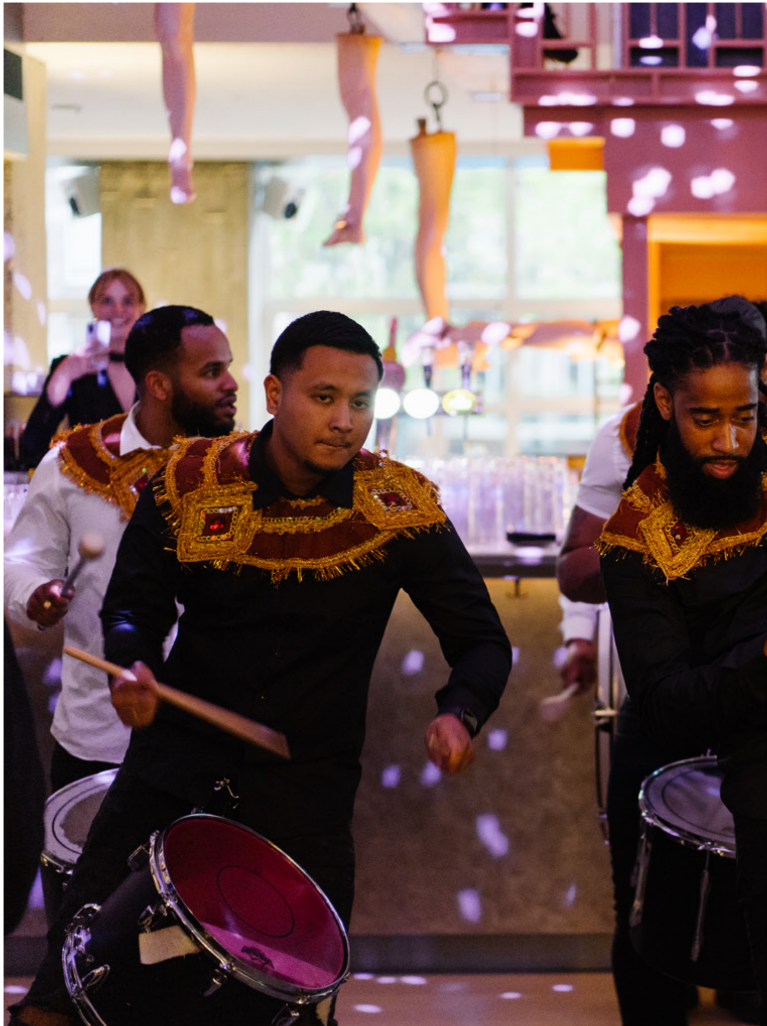
OPENING NIGHT CAPITAL C.