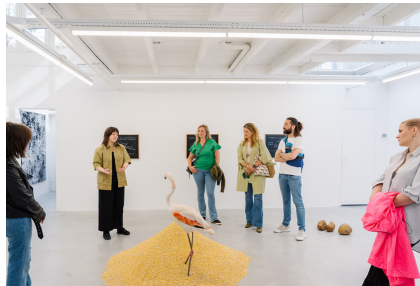
GUIDE MAP.

De Amsterdam Art Calendar is een tweemaandelijks overzicht van het actuele aanbod van de deelnemende instellingen, met een kaart waarop de partners staan aangegeven. De kalender verschijnt in een oplage van 4.500 exemplaren. Het bevat een korte introductie over Amsterdam Art, een plattegrond, de praktische gegevens van de deelnemers, de titel van de tentoonstelling, de namen van de exposerende kunstenaars en een korte introductie over Amsterdam