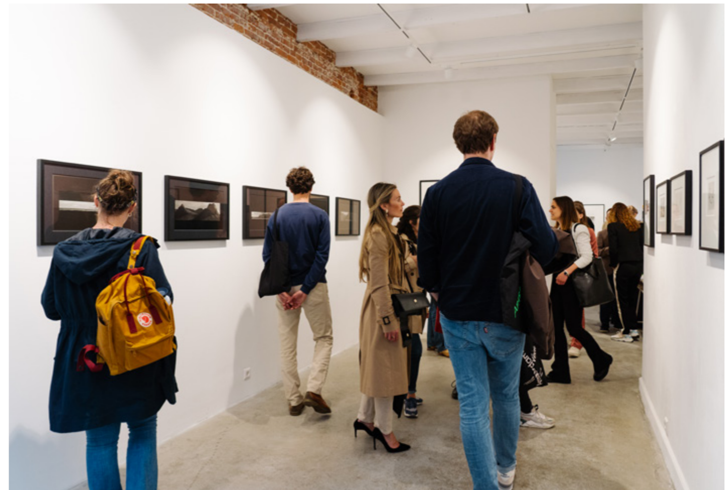
DAY 3, AMSTERDAM ART WEEK, 2022.