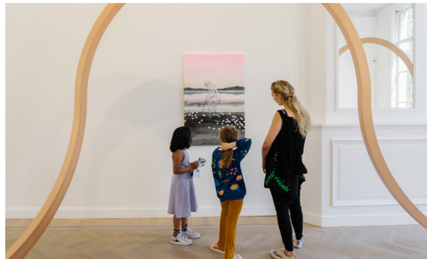
DAG 6, AMSTERDAM ART WEEK, 2022.

○ Fietstour (2x) : We boden ook specifieke fietstours aan, in samenwerking met het Stadscuratorium. Deze fietstours richtten zich op kunstwerken in de openbare ruimte. De tour stond in het teken van publieke werken gemaakt door vrouwelijke kunstenaars. Met deze tours spraken we vooral de Culturele Alleseters en Weelderige Cultuurminnaars aan.